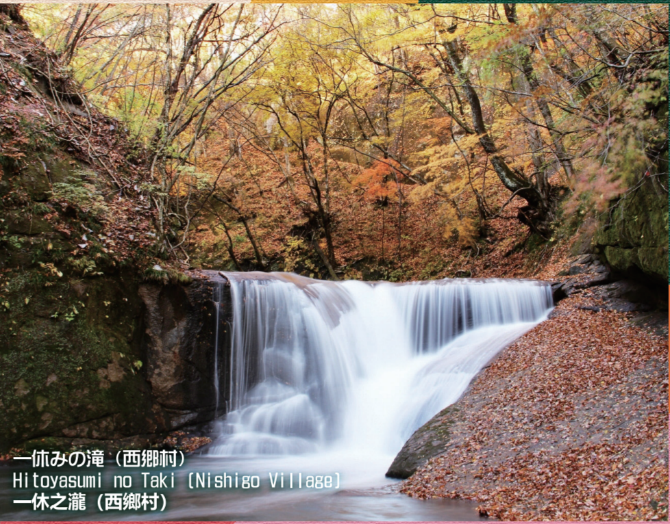
一休みの滝 (西郷村) Hitoyasumi no Taki (Nishigo Village) 一休之瀧 (西郷村)