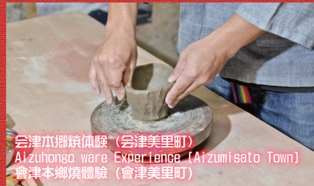
会津本郷焼体験 (会津美里町) Aizuhongo ware Experience (Aizumisato Town) 會津本郷焼体験 (會津美里町)