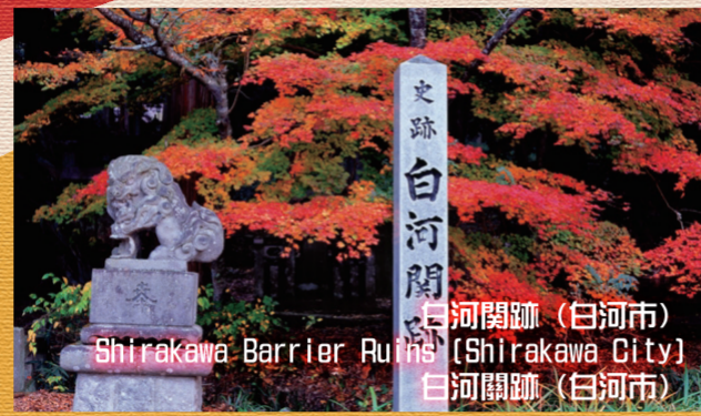
白河関跡 (白河市) Shirakawa Barrier Ruins (Shirakawa City) 白河関跡 (白河市)