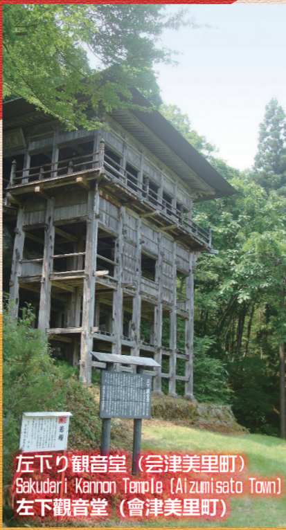
左下り観音堂 (会津美里町) Sakudari Kannon Temple (Aizumisato Town) 左下り観音堂 (會津美里町)