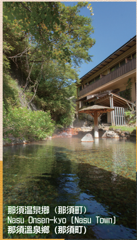
那須温泉郷 (那須町) Nasu Onsen-kyo (Nasu Town) 那須温泉郷 (那須町)