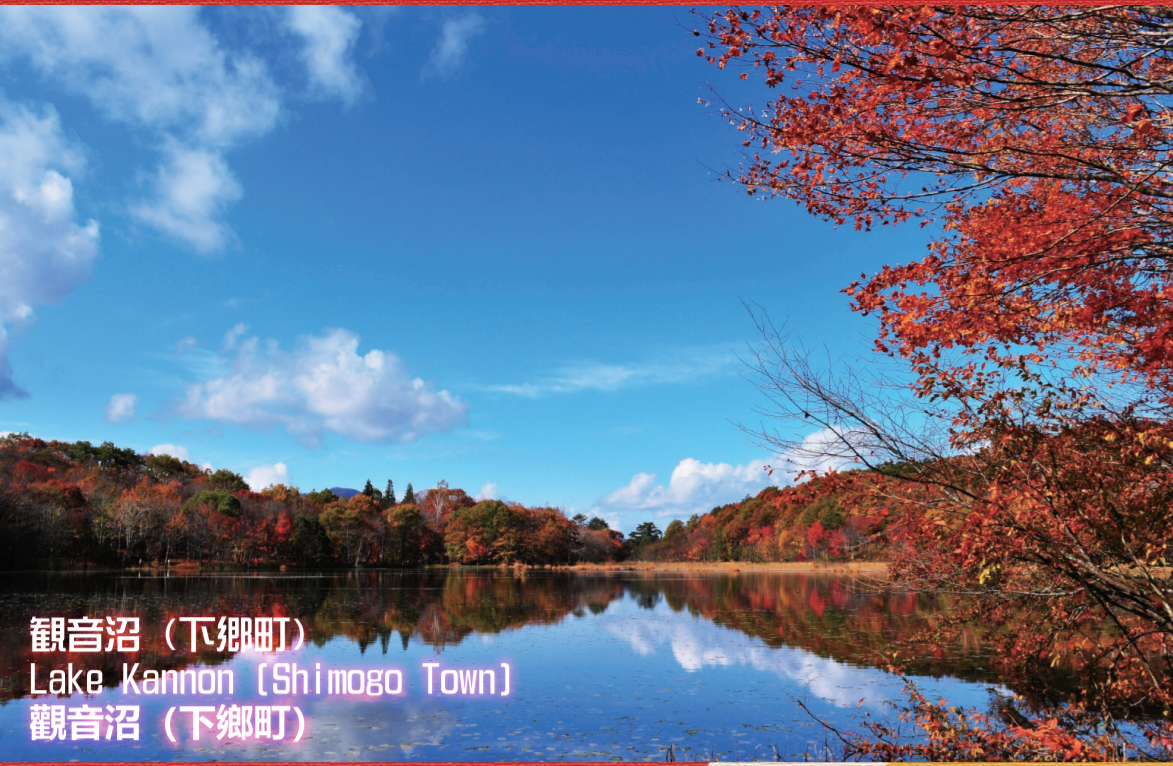
観音沼 (下郷町) Lake Kannon (Shimogo Town) 観音沼 (下郷町)